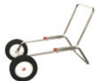
Mulighed for tilkøb af hjulsæt